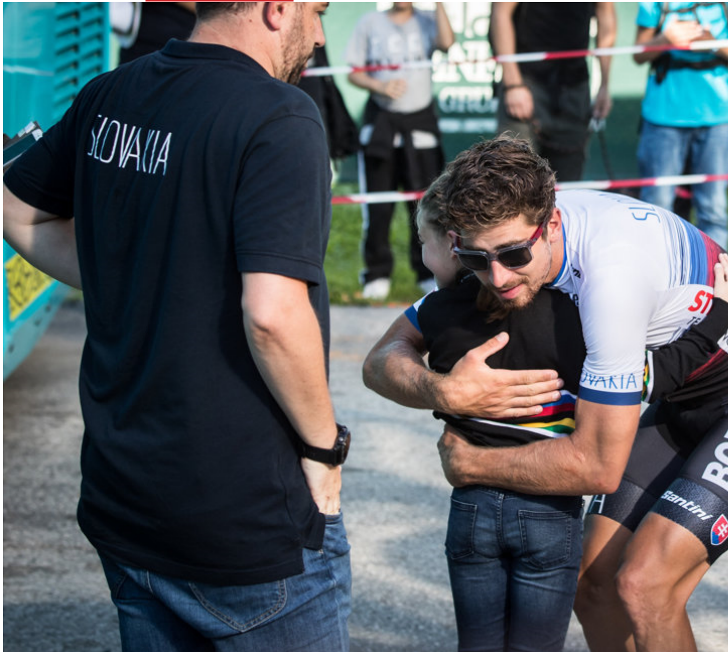
Peter Sagan po odstúpení z pretekov v Innsbrucku.