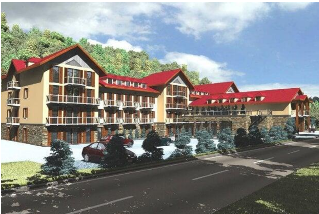
Vizualizácia projektu, ktorý mal nahradiť objekt rybárskej reštaurácie.

Návrh samozrejme vyvolal búrku nevôle. Vznikla aj petícia, ktorej cieľom bolo zabrániť výstavbe ubytovacích zariadení v lokalite Železná studnička. Projekt však tzv. "eiu" nezískal. Úradom totiž nedoručil odborný posudok vplyvu na riekou Vydrica a ani ďalšie potrebné stanoviská.