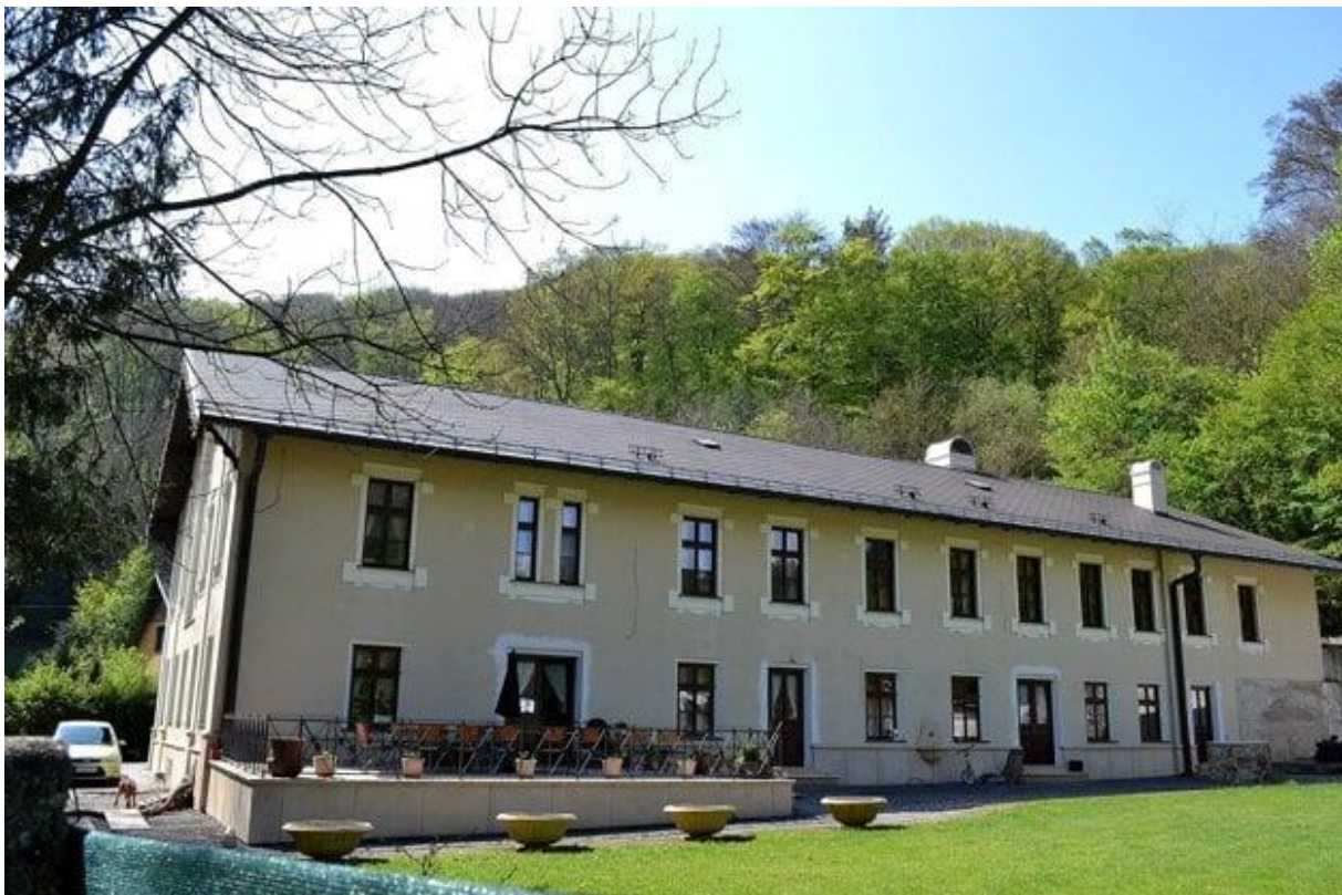
Budova IX. mlyna, ktorá je dnes využívaná ako súkromná rezidencia.

Podnikateľ v objekte aj reálne býva. Podľa informácií INDEXU pritom za rozsiahly areál stále platí štátnemu podniku rovnaké nájomné 1100 eur mesačne.