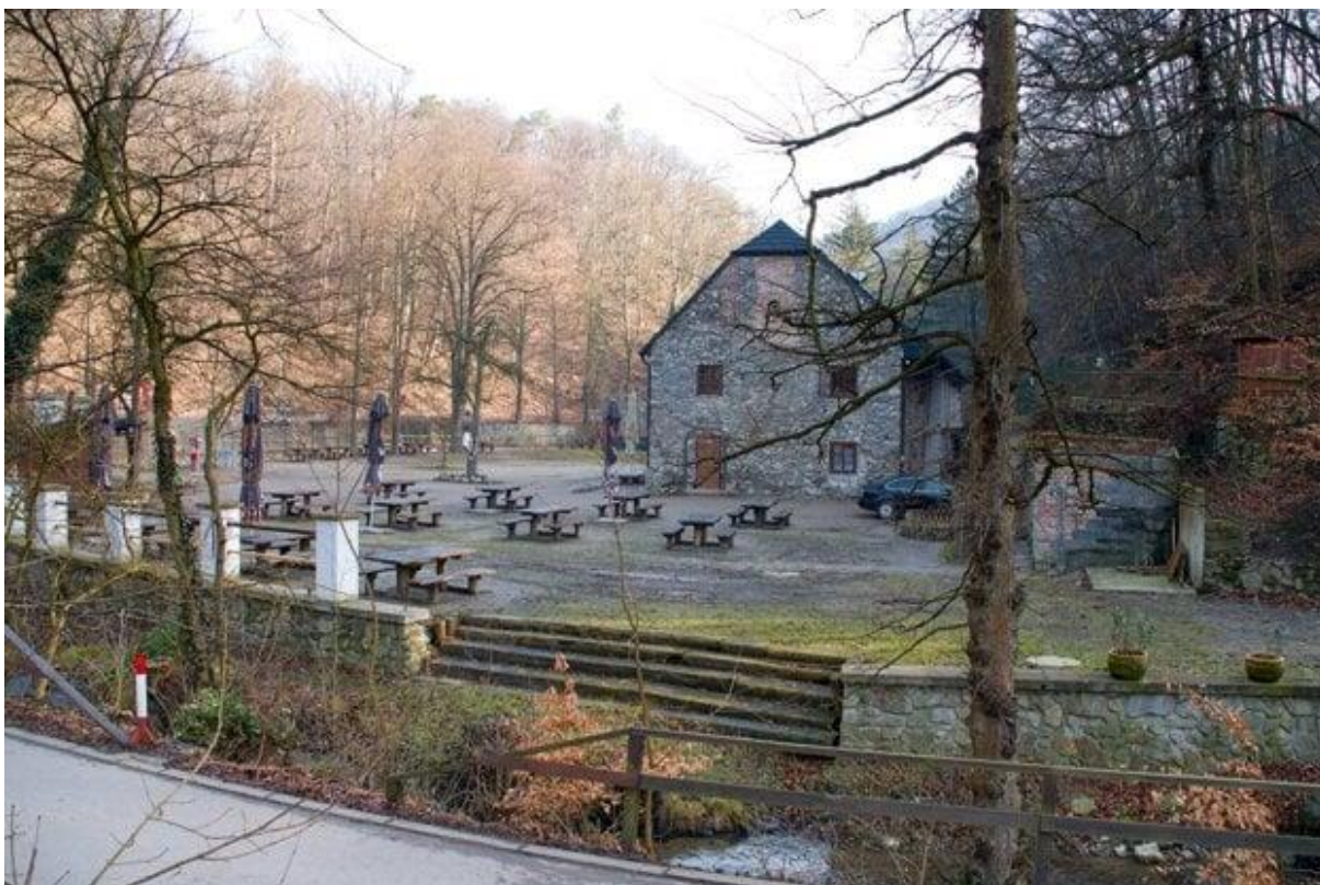
Areál mlyna Klepáč.