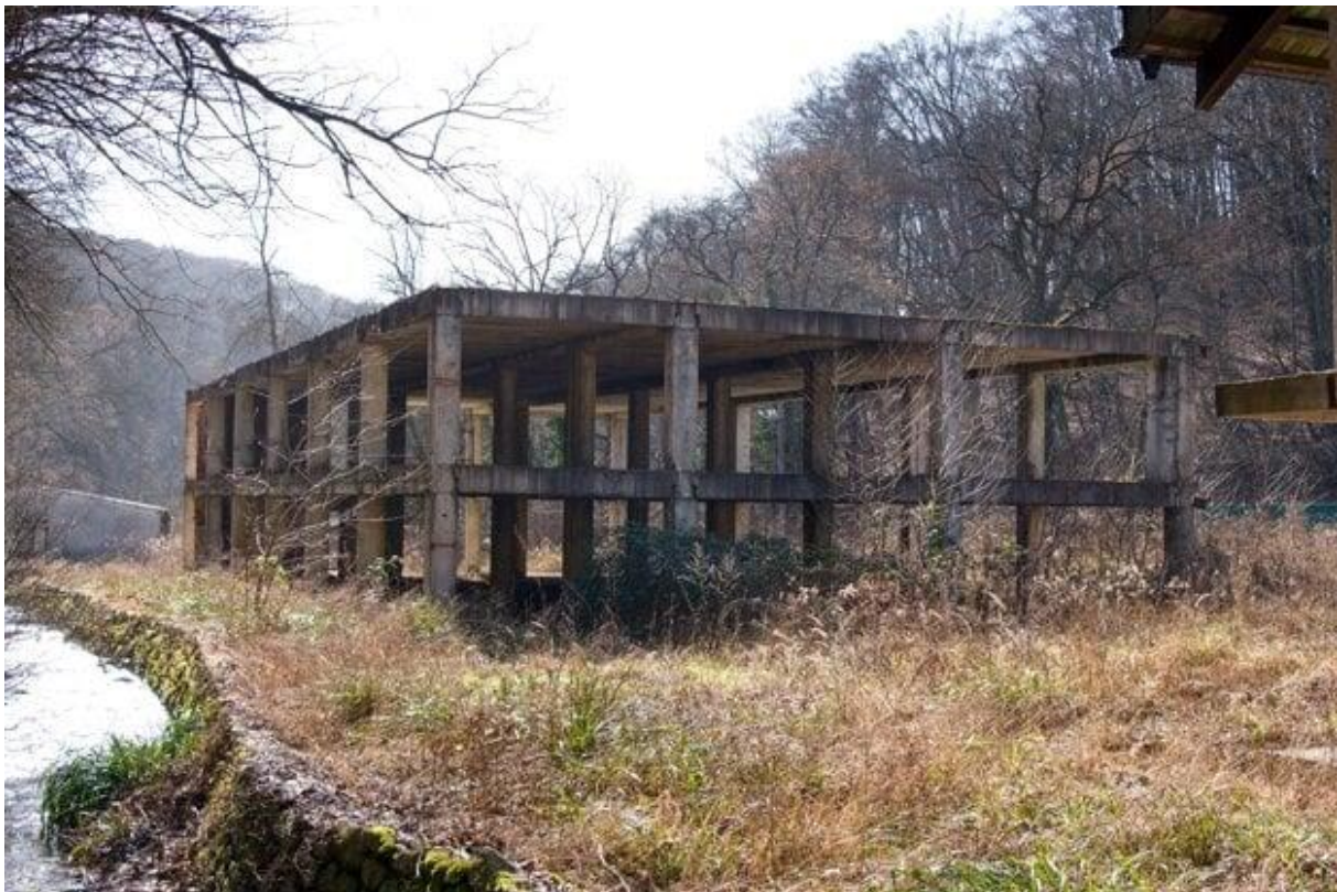
Skelet budovy rybárskej reštaurácie.

Aj keď názov nemusí mnohým návštevníkom lokality nič hovoriť, veľký dvojpodlažný skelet patrí medzi najväčších strašiakov lesoparku. Jeho história sa začala písať ešte v roku 1983, keď úrady odklepli Slovenskému rybárskemu zväzu výstavbu reštauračného objektu.